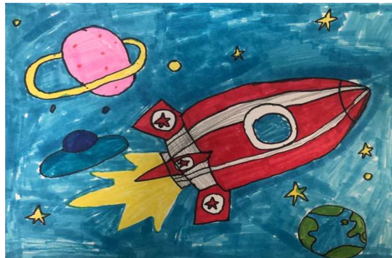
Рисунок Артёма Беженару, 5А класс